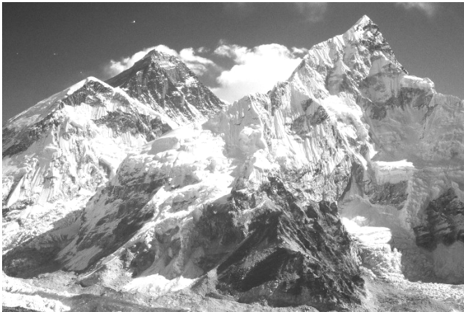
Le Nupste et l'Everest