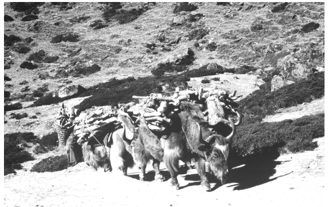
Caravane de yak – Vallée du Khumbu