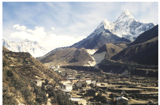
Dingboche au pied de l'Amadablam – Vallée du Khumbu

matériaux nécessaires à la construction des maisons (bois, pierres, ustensiles de cuisine ...). A plus haute altitude, on retrouve plus l'ambiance refuge, les lodges sont moins confortables et ferment fin décembre. Qu'y mange-t-on ? Le plat typiquement népalais est le Dal Bath (riz-légumes-lentilles), c'est très bon mais certains s'en lassent. On peut aussi avoir des soupes (aux nouilles ou tomates ou pommes de terre ...), divers plats de légumes poêlés, des chapati, des œufs, et même quelquefois des plats d'allure plus occidentale que l'on n'a pas essayés. On n'a pas essayé non plus la viande (poulet ou yak), pensant que notre système digestif européen n'était pas compatible avec les méthodes de conservation locales, observées au marché de plein air. Le petit déjeuner pouvait être très local, avec thé au lait et chapati, ou plus continental, avec nescafé, chocolat, toasts grillés, beurre, confiture. Sauf le beurre (de yak, un peu rance), ces ingrédients modernes viennent de la ville par porteur. Malheureusement la confiture est industrielle et ses arômes artificiels m'ont rappelé les glaces à la fraise que l'on me proposait le dimanche à midi dans mon foyer d'étudiantes et qui m'ont dégoûtée des glaces pendant quinze ans.