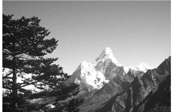
Différents points de vue sur le chemin qui mène au camp de base de l'Everest En haut : l'Amadablam, ci-contre, le Lhoste, le Nupste et l'Everest

faire tourner le moulin ne fait que concrétiser cet état, de même que les prières écrites sur les drapeaux ou sculptées sur les pierres. Ils acceptent leur vie actuelle, dans l'attente d'une vie meilleure.