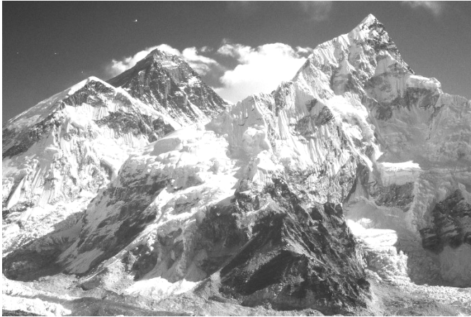
Le Nupste et l'Everest