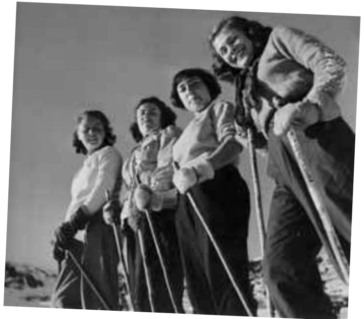
Au cours du même stage.

Dans les prochains Crampons, vous pourrez lire la suite de cette histoire :