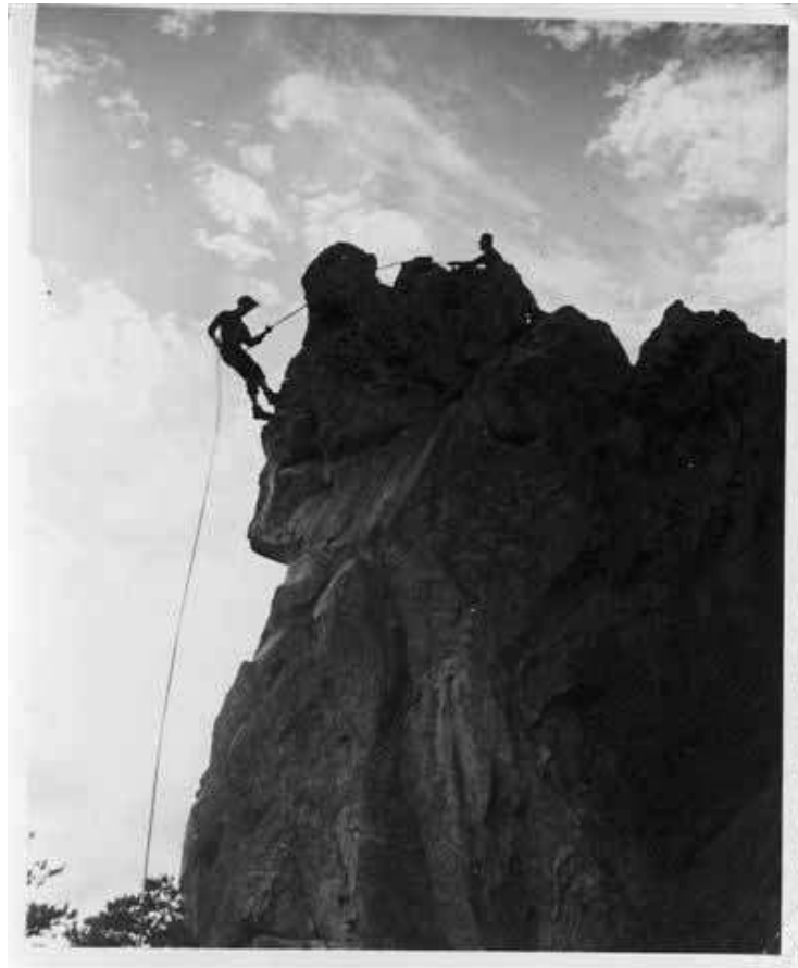
Rappel à la Dame Jeanne (1952-53)