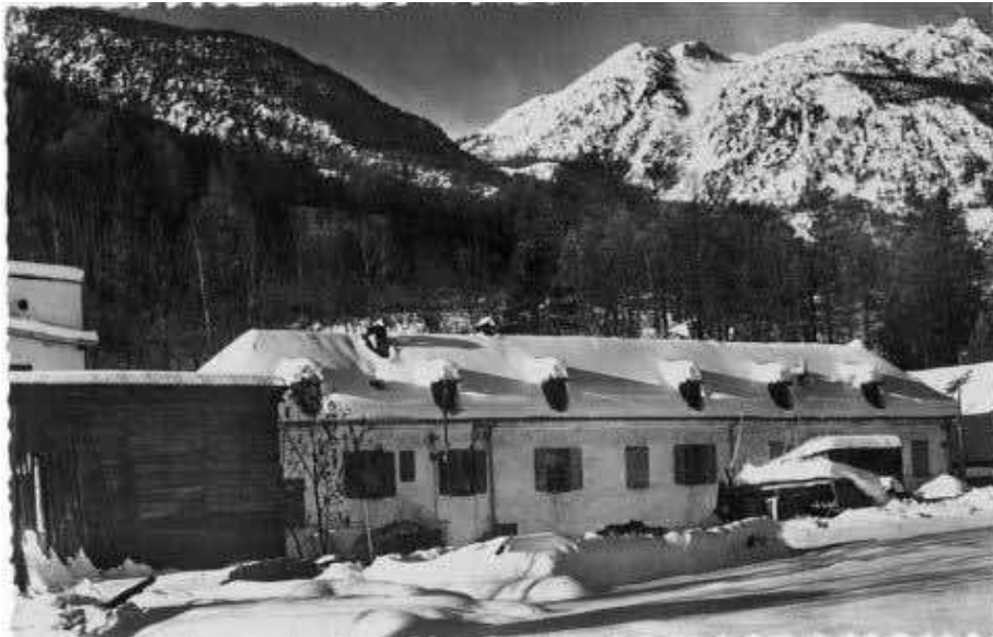
Le bâtiment dit du Moulin Baron qui abrita des stages UNCM pendant de nombreuses années. Carte postale Claude Orlianges.

L'UNCM ferma ce centre dès 1948 et les stages suivant du GUMS eurent lieu dans de meilleures conditions, toujours en Guisane, au Moulin Baron et à l'auberge de jeunesse du Bez, situés à Villeneuve-La-Salle, ou au Champel, près de Chamonix.