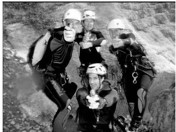
Star Gums One

Croiser une troupe de canyonneurs au détour d'un chemin est, pour le promeneur dominical et rêveur, une expérience aussi fantastique que de rencontrer l'équipe de «stargate».