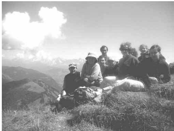
Entre lac et mont Charvin

sur la route d'un camp naturiste (un panneau peut en cacher un autre..). Trois générations de savoyards dans cette ferme, des petits veaux qui venaient juste de naître, des chatons, des fromages bien frais bien faits. On y est revenus plusieurs fois.