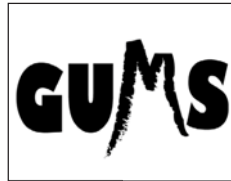
F 13 voix