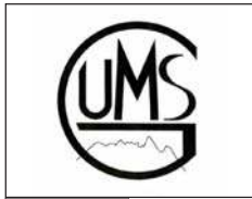
A 15 voix