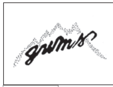
G 14 voix