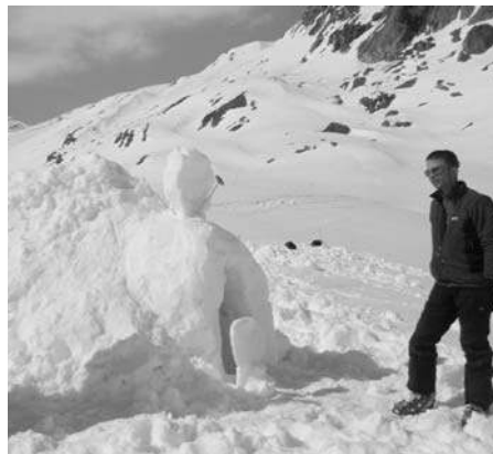
L'igloo avec réception satellite.