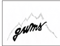
E 26 voix