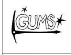
H 12 voix