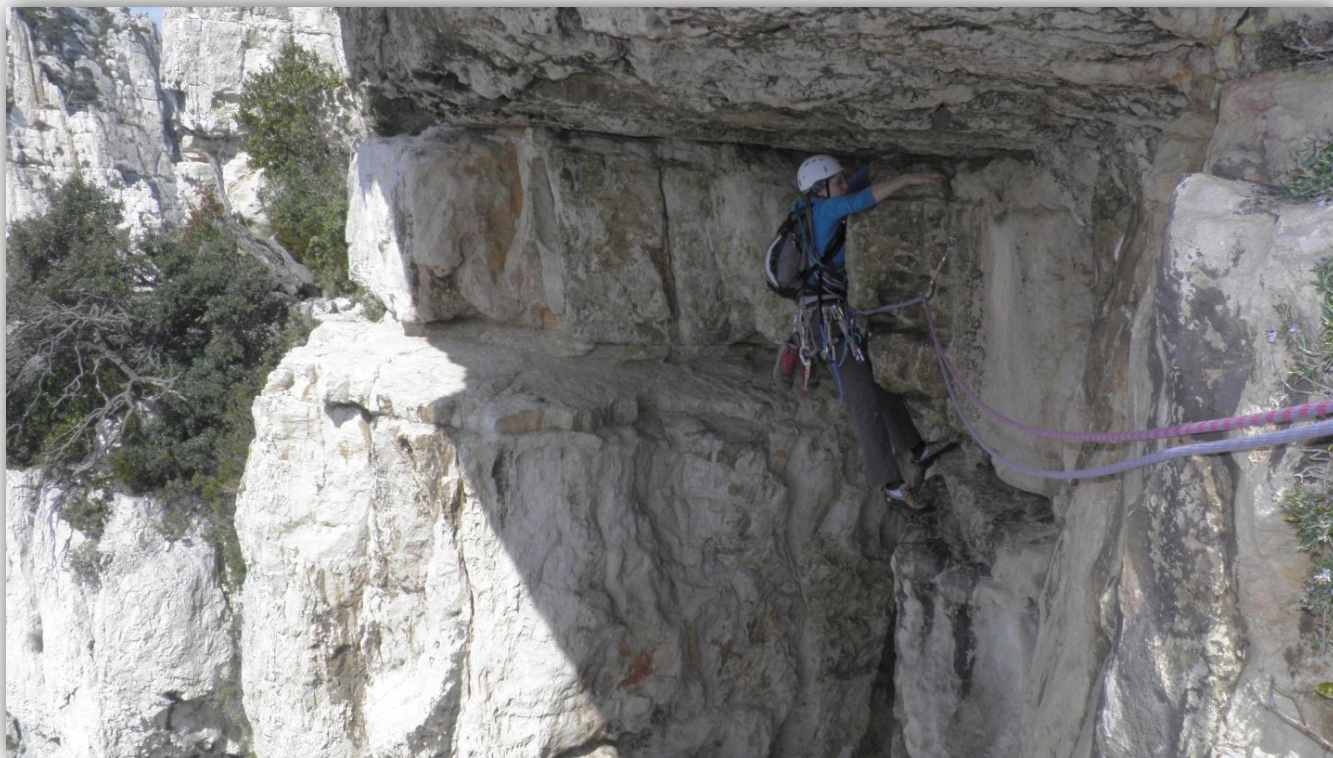
En pleine traversée