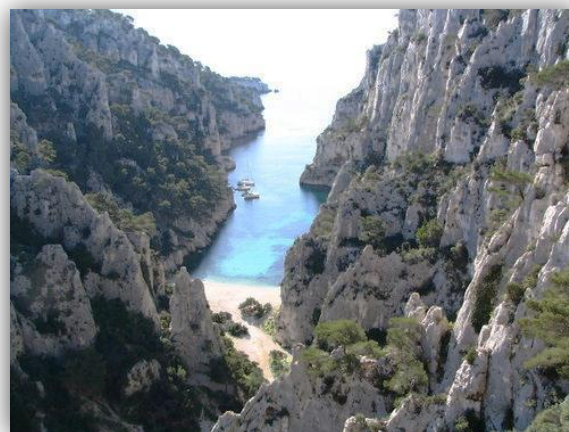
Calanque d'En Vau

Durée de notre fameuse marche d'approche que le destin a souhaité rallonger pour re-découvrir le magnifique paysage des calanques alentours. En tête, topo à la main, j'ai fait exactement la même erreur d'orientation que l'année dernière... Au moins, je suis logique avec moi-même ! Allez, direction le « Trou du canon » !