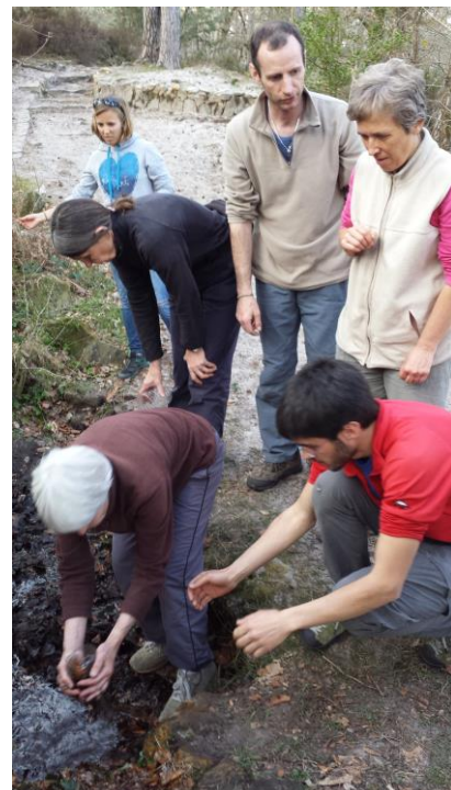
Jeux d'eau à la fontaine Désirée

Plus loin une balise, perchée sur une corde, faisait face au médaille de Némorosa où seule la tyrolienne permettait d'aller y lire son nom. Les enfants comme les grands se sont amusés à s'en rapprocher et profiter ensuite de la tyrolienne pour revenir au sol.