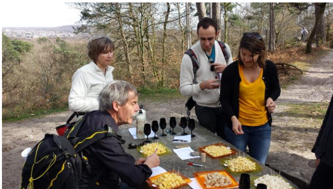
Atelier dégustation à la fontaine du Touring Club

Au détour de la fontaine du Touring Club , les treize équipes ont pu marquer une pause autour de fromages (Abondance, Beaufort, Comté 6 mois et 18 mois, Tomme et Tomme de chèvre), de vin rouge (Saumur Champigny) et de vin blanc (Bourgogne Aligoté) qu'il fallait déguster à l'aveugle pour les identifier.