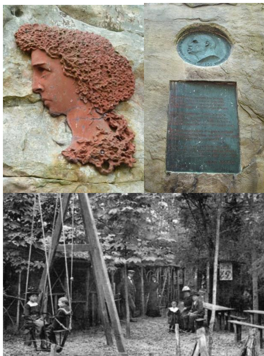
Médailles - Buvette de la Roche éponge

Il est également à noter qu'il a été qualifié de "dangereux terroriste" pour avoir proposé puis participé très activement avec quelques autres camarades en 1992 au démontage de la via ferrata du Mont Aiguille. Une action symbolique sur un sommet symbolique voulant montrer que l'on ne peut pas réaliser impunément tout et n'importe quoi en montagne.