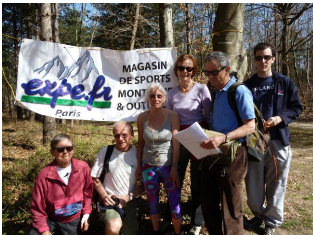
Une des équipes au départ