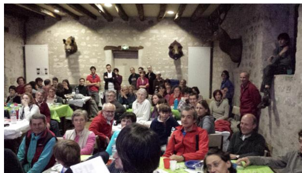
Remises des prix après le dîner

Les noms des balises représentent les personnes ou associations qui ont œuvré ou qui œuvrent toujours pour l'aménagement et la préservation des richesses de Bleau et ses circuits d'escalade . La liste n'est nullement