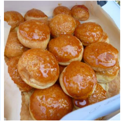
Extraits de desserts...