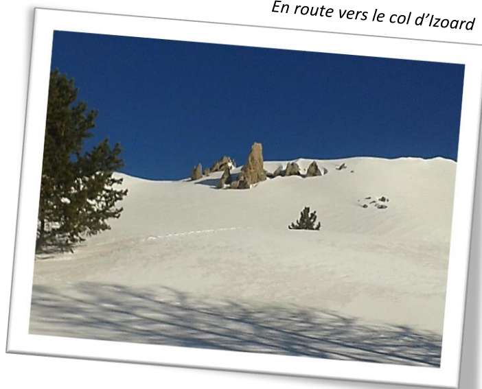
En route vers le col d'Izoard

et les autres arrivent au fur et à mesure de la journée et nous découvrons l'auberge de l'Arpelin, qui ne faillira pas à sa réputation concernant son accueil peu courtois ! Je profite également de cette journée pour découvrir le matériel et mettre enfin des images sur le vocabulaire technique.