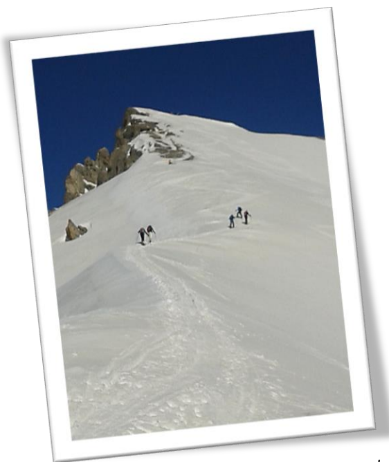
Montée au sommet de l'Arpelin, arête sud

Cela faisait maintenant un an et demi que j'avais le souhait de me mettre au ski de randonnée. Suite au stage d'initiation escalade effectué en 2011, j'ai rapidement découvert que le ski de rando, qui occupe une place importante au GUMS, permettait une belle alternative entre le car-couchette d'escalade de novembre et celui du printemps suivant. La découverte de cette activité, complète et autosuffisante, a petit à petit fait sa trace dans mon esprit lors des sorties en ski alpin. L'envie de quitter les boulevards blancs, de pouvoir se promener où bon me semble, de ne pas payer une fortune pour des embouteillages et des structures à moitié assumées.