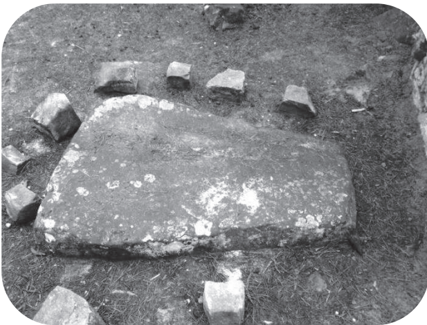
La table de pierre au village des carrières des Gorges du Houx