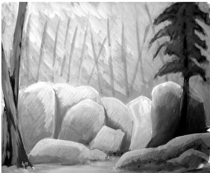
Isatis – Yvon Lagadec