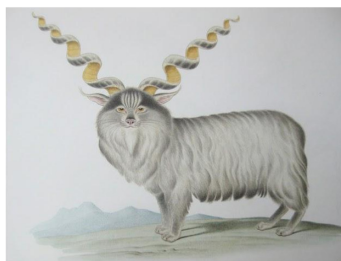
Vrillette des neiges