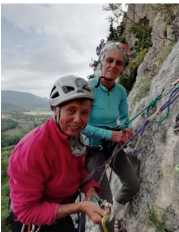
Saou - dans Vitamine A-C