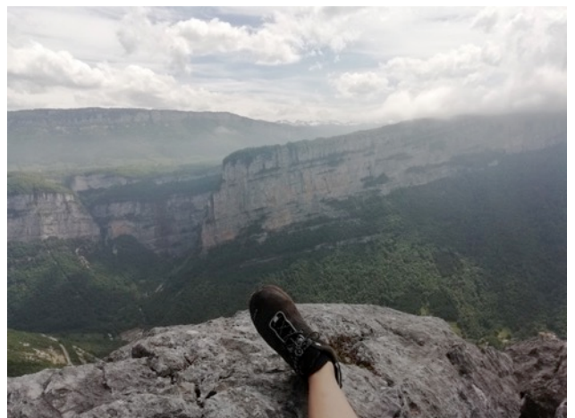
Presles - en haut de Gazogum