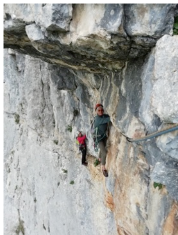
Presles - dans Désirée