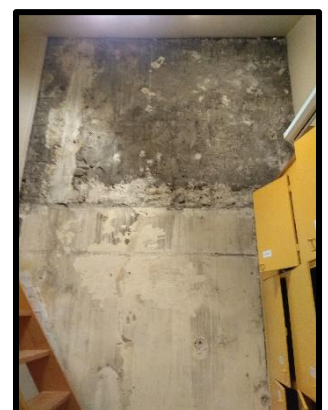
Le mur d'escalade