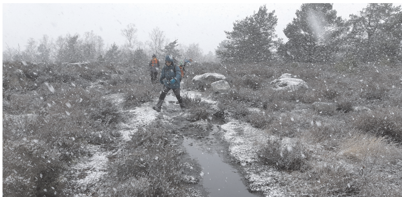
Tempête de neige sur la Platière du Coquibus