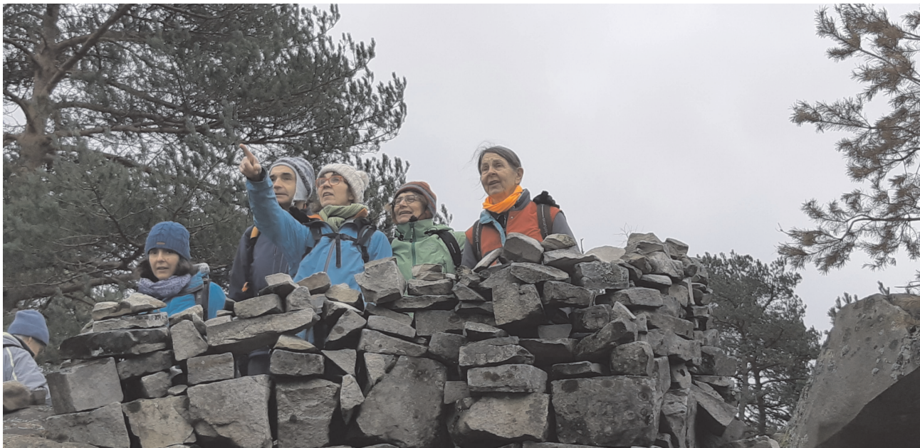
Le fortin de La Roche-qui-Tourne, au Coquibus