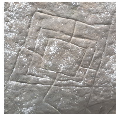
Triple enceinte au Mont Aiveu

Ce qui est bien aussi, c'est qu'une même balade peut réunir des amateurs de différentes options, et que chacun y trouve son compte (sauf ceux qui auront un objectif de performance de temps ou de dénivelé). Les balades dominicales bellifontaines de ces derniers mois nous en ont donné un petit aperçu, avec :