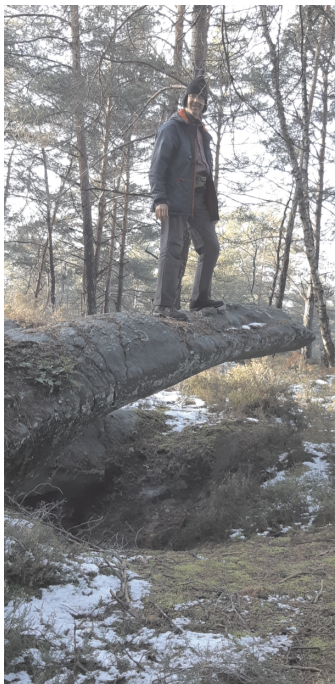
Le crocodile des Coulevreux

Une première option, en forêt domaniale, est d'emprunter les sentiers bleus Denecourt. Ce sylvain de la fin du XIX e siècle a suffisamment arpenté la forêt en long en large et en travers pour y dénicher bon nombre de rochers aux formes improbables, des sentiers bucoliques et des points de vue autrefois imprenables – qui, hélas, tendent à disparaître avec la croissance des arbres et la progression des surfaces boisées. Cela permet de marcher nez au vent sans avoir l'œil rivé sur la carte. Et si, en plus, on s'est muni du précieux guide des AFF 2 , on peut faire correspondre les repères en lettres bleues des rochers caractéristiques aux noms que leur a attribués Denecourt (ou son successeur Colinet), ce qui permet d'être encore plus réceptif à des curiosités qui auraient pu nous échapper au passage.