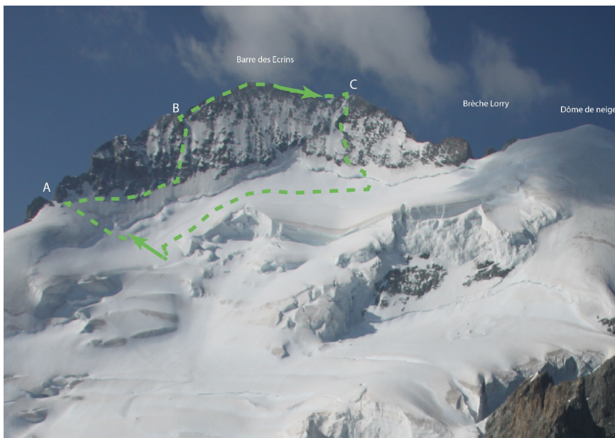
Vue de la face Nord de la Barre des Ecrins depuis Roche Faurio le 23 juillet 2021 et report approximatif de l'itinéraire de la première.