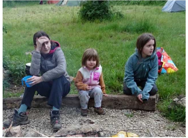
La relève est assurée !