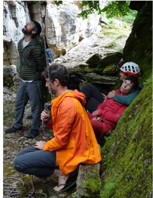
Coming out (et deux qui font semblant de regarder en l'air ou à leurs pieds)