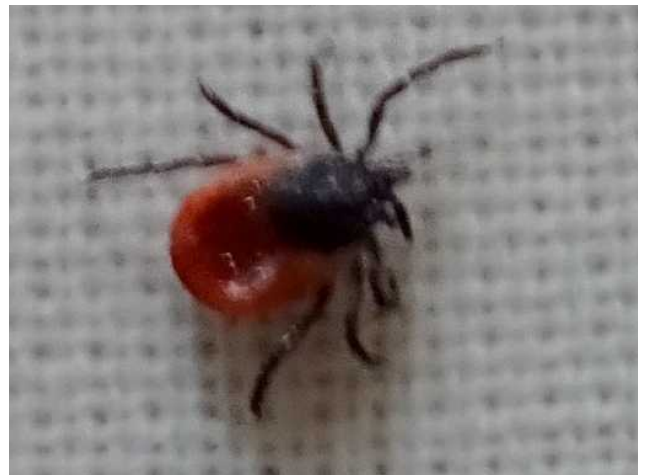
Gore ou « dans la jungle bourguignonne » (on remarquera que la tique n'est pas un insecte mais un arachnide)